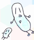
ヨーグルト (乳酸菌)