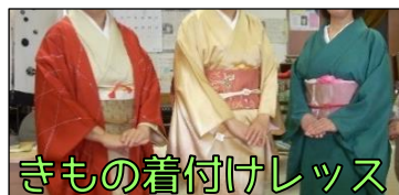
きもの着付けレッス