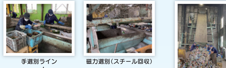
手選別ライン 磁力選別(スチール回収) ごみ袋はがし

リターナブル瓶選別 ※リターナブルとは 洗って繰り返し使える ビール瓶・一升瓶など