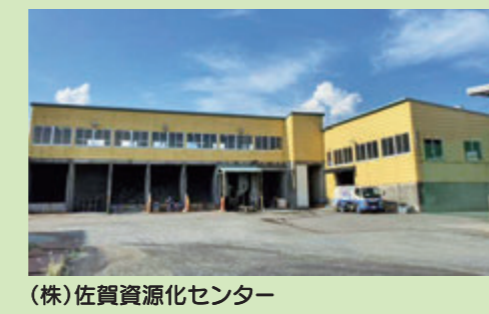
(株)佐賀資源化センター